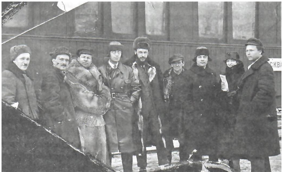
Сибирские писатели с Борисом Пильняком. 1924-1925 гг. В центре – В. Я. Зазубрин