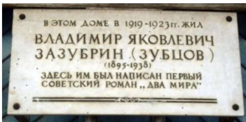
Мемориальная доска на доме, в котором жил В. Я. Зазубрин, г. Канск