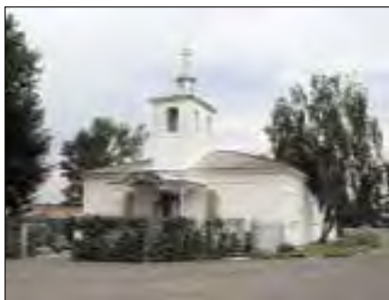
Шушенский храм Петра и Павла