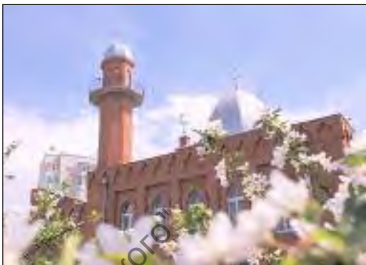
Соборная мечеть в г. Красноярске