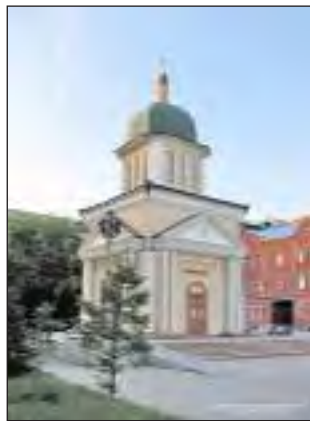
Храм-часовня Димитрия Солунского