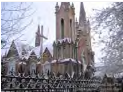
Католический храм в г. Красноярске