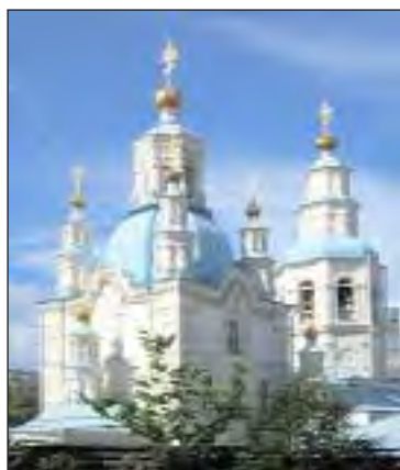
Покровский собор в г. Красноярске

832. Лапин, Д. Всесвятская история: [История церкви Всех Святых и Всесвятского кладбища] /Д. Лапин //Красноярский комсомолец. - 1995. - 17 июня.