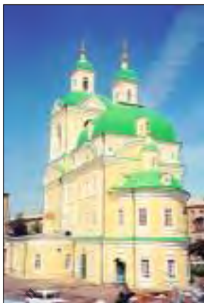
Благовещенский женский монастырь г. Красноярск