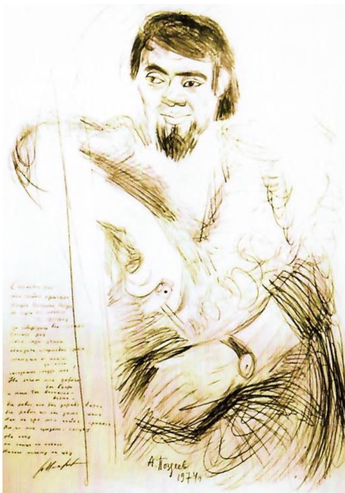
В. Назаров, рисунок А. Поздеева, 1974 год.