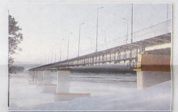
Мост через Ангару