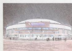
Многофункциональный комплекс «Арена. Север» – главная хоккейная арена края