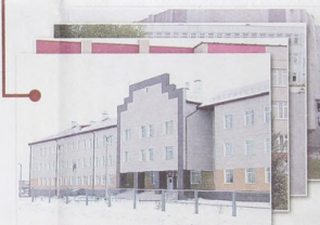
В январе 2014 года в Филимоново введена новая школа на 504 места

За 10 лет в крае построено 54 спортивных комплекса и 2 700 школьных и дворовых спортплощадок