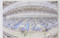
Богучанский алюминиевый завод