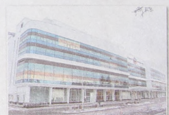
Футбол-арена «Енисей» – единственный крытый футбольный манеж в крае