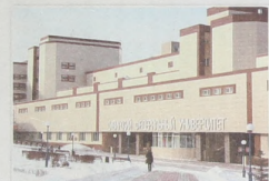
Сибирский федеральный университет