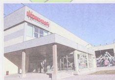
Физкультурно-спортивный центр «Южный» в Минусинске введен в 2012 году

В крае за 10 лет намолочено более 25 миллионов тонн зерна. Максимальный урожай выпал на 2009 год – 2,7 миллиона тонн