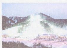
Фанпарк «Бобровый лог» – центр развития горнолыжного спорта и сноуборда