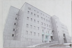
КГБУЗ «Красноярский краевой клинический онкологический диспансер им. А. И. Кривоногова»