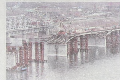
Четвертый мост через Енисей в Красноярске