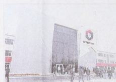
ЦЭС «Спортэкс» – единственный центр за Уралом для развития экстремальных видов спорта