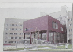
Краевой перинатальный центр