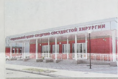
Федеральный центр сердечно-сосудистой хирургии