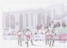
Спортивный комплекс «Академия биатлона» – главная база по подготовке сборных команд края по биатлону