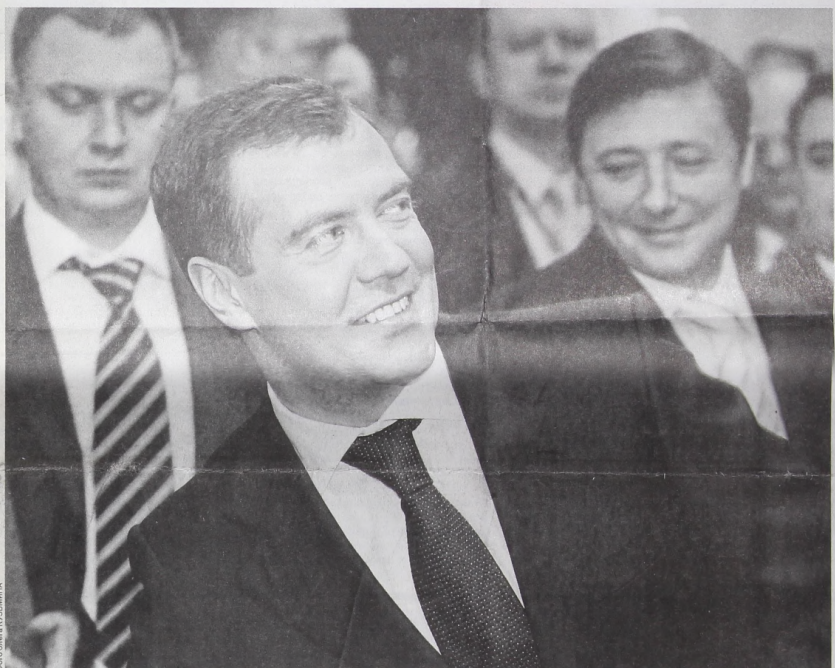
Политическая программа Дмитрия Медведева впервые прозвучала в 2007 году на КЭФ

Предпосылкой для оптимизма пока больше. Надежду на то, что решения форумчан окажутся эффективными, вселяют результаты прошлогодних «мозговых штурмов». Судите сами, в прошлом году мы еще лицом к лицу стояли с «великим и ужасным» мировым кризисом. Первая волна заставила мировое сообщество и Россию ломать умы над выходом из тяжелой ситуации. Сегодня же кризис стал реальностью, с которой можно справиться, и с которой можно говорить уже не «кризис», а «новые экономические условия». Именно условия, в которые можно и нужно встраиваться, адаптируясь не только бизнес, но и ментальность. Что касается антикризисных рецептов, разработанных в 2009 году в Красноярске, то их успешное практиковала вся страна. Например, на одной из площадок VI форума обсуждали механизмы господдержки. Именно этот диалог власти и бизнеса во многом стал основой антикризисных мер, которые сегодня реализуются правительством РФ.