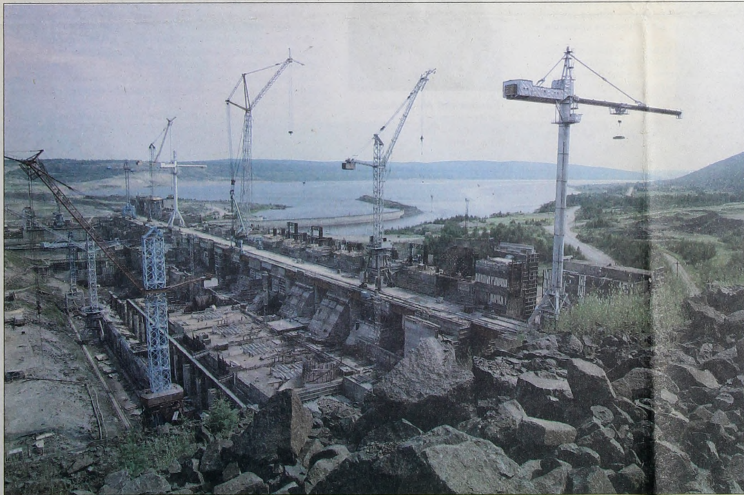
Новые крупные индустриальные объекты растут на глазах. Богучанская ГЭС.