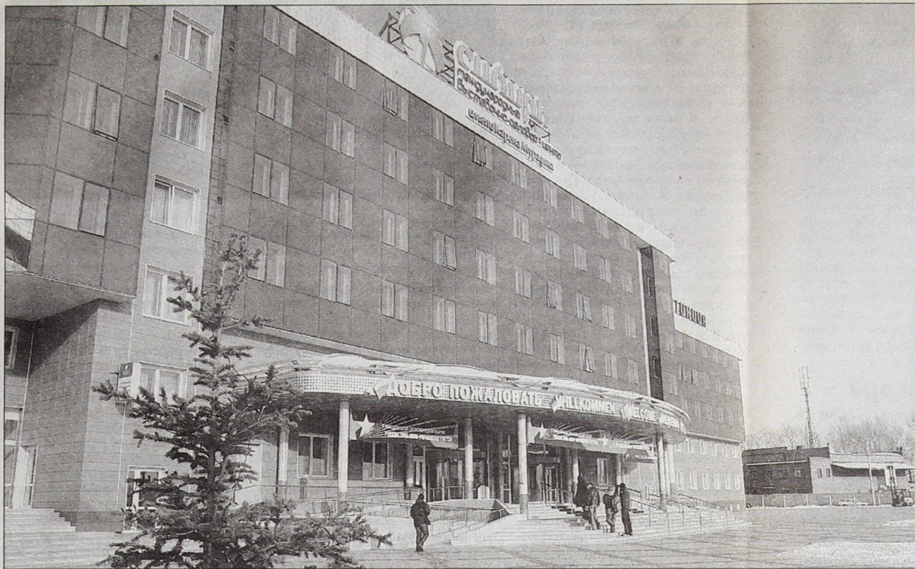
Международный выставочно-деловой центр «Сибирь» встречает гостей.