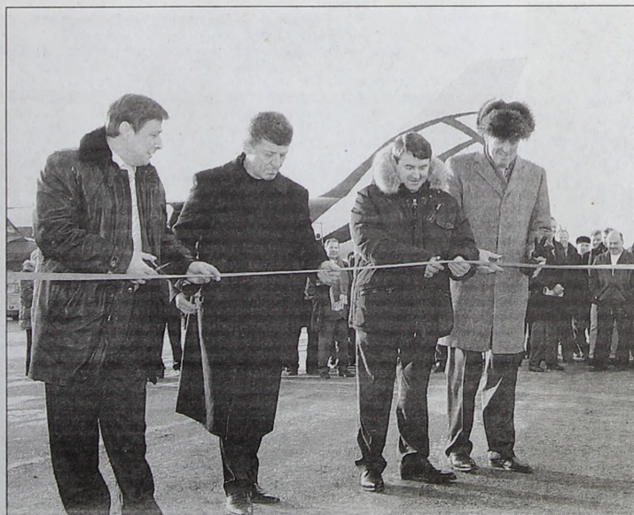
Красная инвестиционная ленточка на открытии грузового терминала.

Юрий ЧУВАШЕВ.