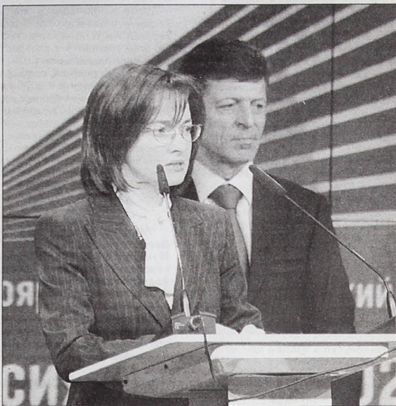
Министр экономического развития и торговли РФ Эльвира Набиуллина и министр регионального развития РФ Дмитрий Козак: новый курс становится реальностью.

В этом перечне любое имя на слуху: генеральный директор ОАО «СУЖ» Владимир Рашевский, президент ОАО «НК «Роснефть» Сергей Богданчиков, председатель государственной корпорации «Банк развития и внешнеэкономической деятельности (Внешэкономбанк)» Владимир Дмитриев, председатель