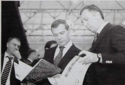
Дмитрий Медведев узнает у Олега Дерипаски, что нужно бизнесу

Привел пример успешной политики, в чем правительство РФ сейчас гордится, считая своей «зачеткой». — Развитие технологий дождички не перешло в энергетике. Промышленные комплексы возникают так, где достают энергию. Причем если инвесторы участвуют в софинансировании тех проектов в электроэнергетике, которые создаются с применением новейших технологий, не забывая также и о своей ключевой задаче в этой сфере, а именно — задаче строительства сетей.