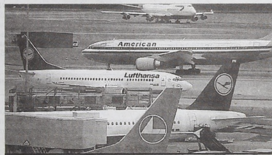
Когда-нибудь красноярский аэропорт будет похож на Хитроу

связет аэропорты Виннипега и Красноярска. На предстоящем в середине февраля V Красноярском экономическом форуме «Россия 2008–2020. Управление ростом» губернатор региона Александр Хлопонин и министр инфраструктуры и транспорта провинции Манитоба Рон Лемье должны подписать соответствующее соглашение о сотрудничестве. После этого проект более детально должен быть согласован в МИД России и Минтрансе.