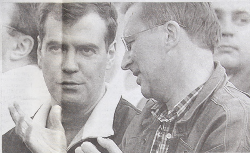
К нам придет практически все правительство

Между тем в администрации Красноярского края считают, что заключение соглашения с канадцами стало бы логичным продолжением развития Красноярского транспортного узла. Российские