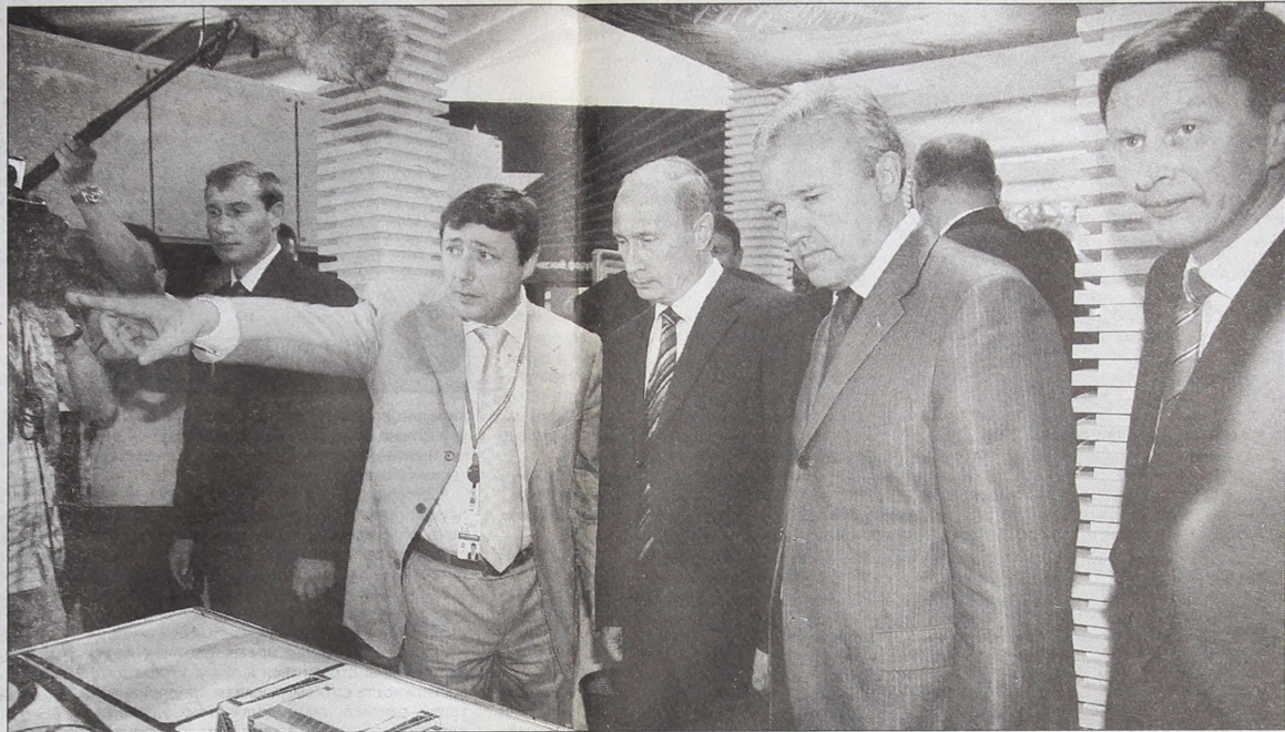
Презентация космической навигационной системы «ГЛОНАСС-К».

Одной из самых многочисленных на форуме в Сочи была делегация Красноярского края, в состав которой вошли представите-