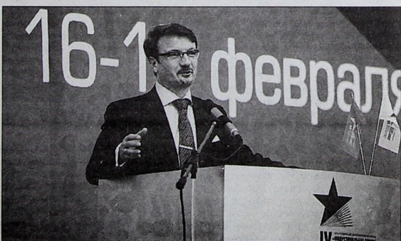
Авторитетное слово Германа Грефа.