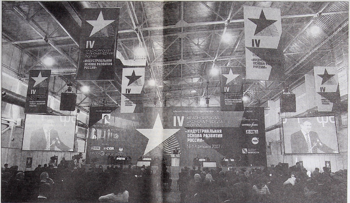
Здесь решалось будущее края.

Это не означает, что на европейской территории страны до 2020 года будет вложено меньше