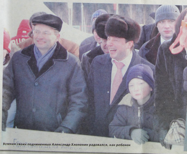
Успехам своих подчиненных Александр Хлопонин радовался, как ребенок