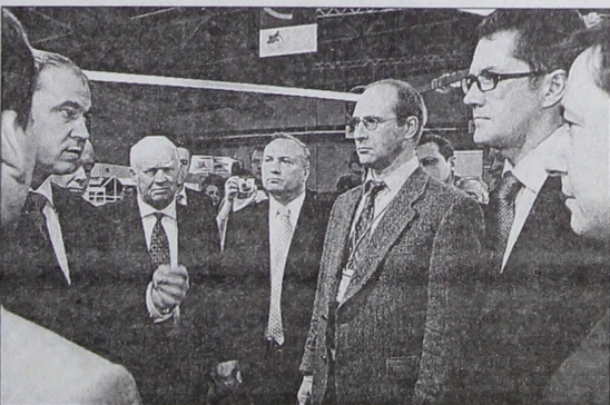
Судьба Сибири в руках инвесторов

Не только грамотная и экономически эффективная разработка природных недр, но прежде всего создание высокотехнологичных и перерабатывающих производств заметно толкнёт Сибирь вперёд — истина, с которой не поспоришь. Особенно это актуально для отечественного лесопромышленного комплекса. Площадь российских лесов составляет более 850 млн