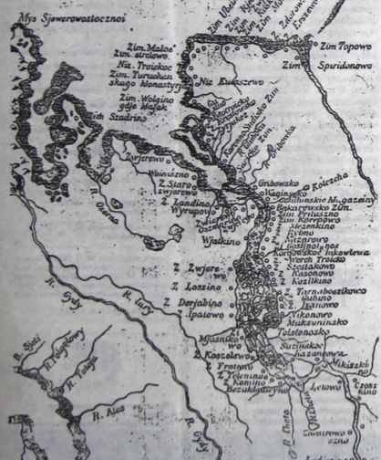
Карта устья Енисея от Atlas Russicus, изданного напечат. Императорской Академии Наук в 1746 году.