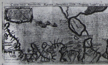
Карта «Северной России, страны самоедов и тунгусов», составленная Исааком Массой и опубликованная в Голландии в 1602 году.