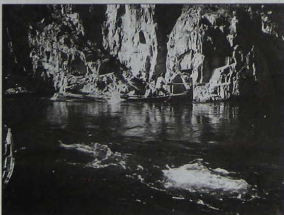
Енисей выше деревни Означенное. Таловские камни. Большая глубина и очень быстрое течение. На вёслах не подняться. Передвижение с помощью багра.