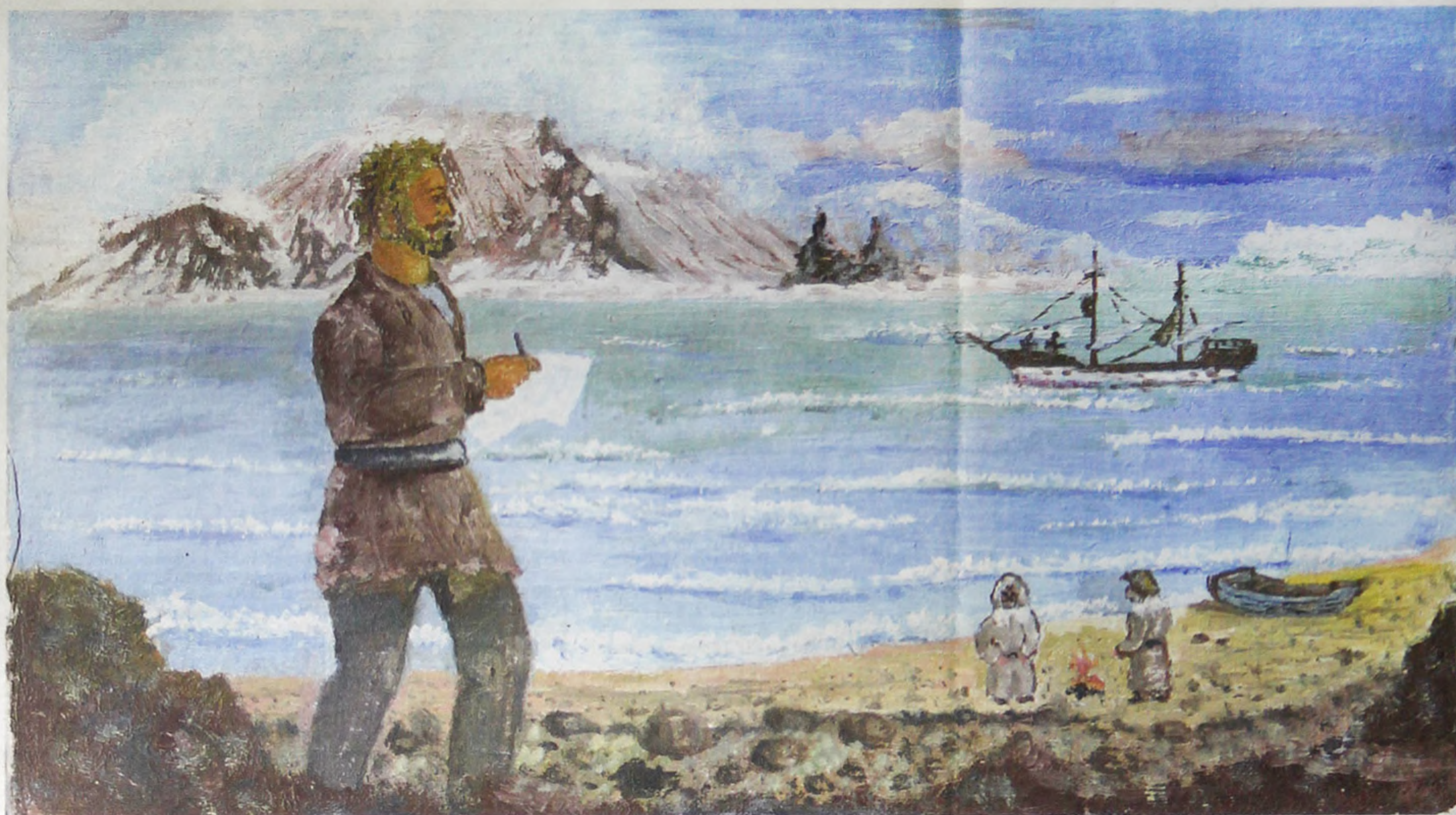
Полярные исследователи на Новой Земле.