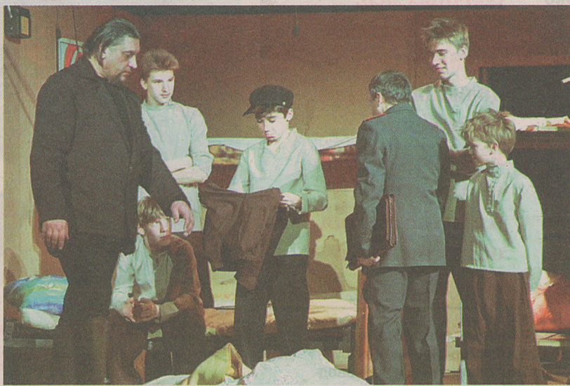
Премьера спектакля «Трещина» состоялась в 2018 году

Он отличался от других сотрудников детского дома, и благодаря ему узнали, что есть «дру-