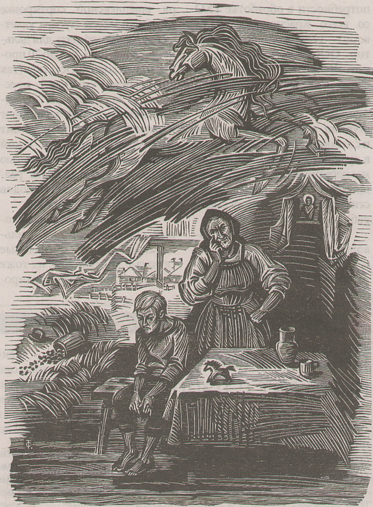
С. В. Тимохов. Иллюстрация к рассказу «Конь с розовой гривой»

Писать рассказ в своей Быковке Астафьев сел в шесть утра, и в шесть вечера произве-