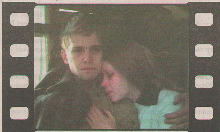
Кадр из фильма «Звездопад»

– Семь. – А специальность? – Была специальность... да сплыла. – Вот видите, вот видите, – подхватила она. – Лидка тоже еще на перепутье. Институт даже не кончила. В общем, Михаил, будьте взрослым. Сделайте так, чтобы ваши отношения не зашли далеко. Ну вы меня понимаете!..»